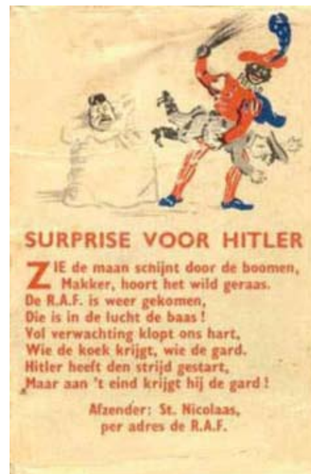
Toffeeudoosje van de Royal Air Force (1941) met een spotprent en een schimpdicht gebaseerd op een bekend Sinterklaasliedje.

Een brief die eveneens uit dit archief afkomstig is 6 , vertelt het verhaal van een bezorgde vader die zonder extra steun zijn 7-jarig